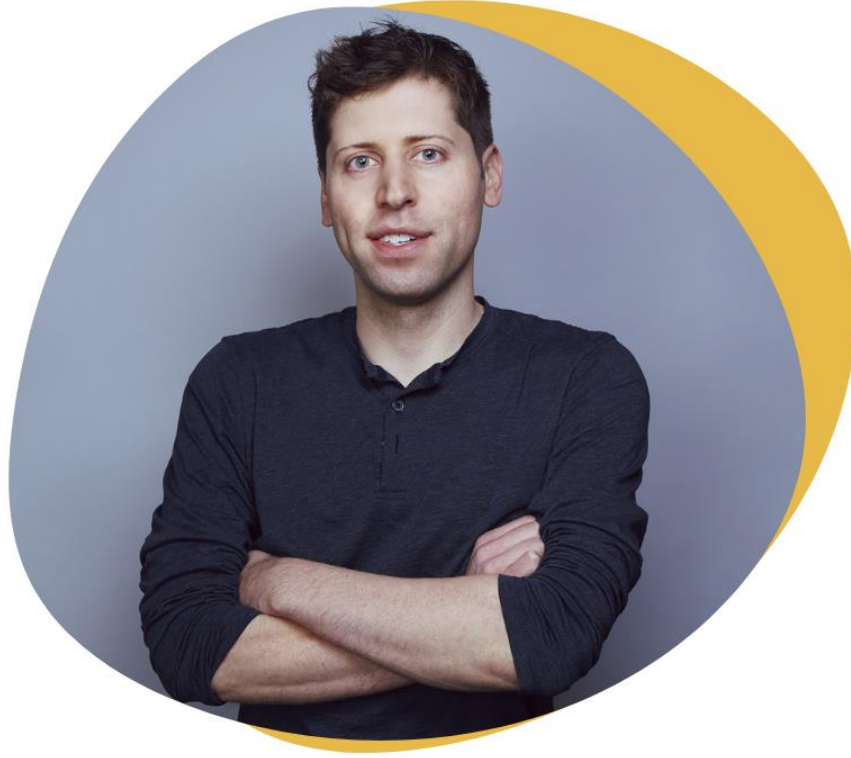
سام ألتمان، مؤسس CHATGPT

إن أدوات الذكاء الاصطناعي ستحدث ثورة في التعليم مثلما فعلت الآلات الحاسبة، لكنها لن تحل محل التعلم